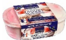
Un florilège de saveurs.

Reconnu internationalement pour ses crèmes glacées et ses sorbets plein fruit, L'Angély's vous prend par les sentiments avec une série de glaces gourmandes dont vous ne pourrez pas vous passer cet été. Un florilège de saveurs aussi délicates qu'inventives, élaborées avec cet amour du produit qui fait de ces glaces de ce maître artisan glacier de Charente-Maritime des modèles du genre. La Maison propose : praliné aux éclats d'amandes caramélisées ; yaourt au lait entier et coulis de fruits exotiques ; yaourt au lait entier et coulis de framboise ; vanille, noix de pécan et coulis caramel. Depuis 20 ans,