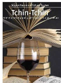
Humour et légèreté.

Et avec le vin, tout commence toujours par une petite ou une grande histoire... Les sujets sont très variés. A travers le temps et les âges, les contes, les fables, les histoires vraies ou fausses, les galéjades, les deux auteurs nous entraînent dans l'imaginaire du vin. Avec humour et légèreté, ils nous dévoilent plus de 66 nouvelles autour du sarment et du raisin. Les anecdotes aussi divertissantes qu'instructives réserveront bien des surprises aux lecteurs. On découvre, par exemple, l'apparition du design de la bouteille du vin, que Napoléon coupait son Grevy-Chambertin, un grand de Bourgogne, avec un volume d'eau équivalent, ou bien encore qu'un Bordeaux serait l'ancêtre du célèbre Coca-Cola ! L'œno-ophile, Sylvain Torchet, a fourni