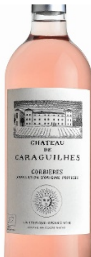
Un vin charmeur.

Prix moyen 8 €, en vente à la propriété. Château de Caraguilhes, tel. 04.68.27.88.99 ; www.caraguilhes.fr