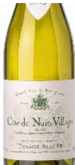
Un Côte de Nuits-Villages tout en rondeur.

Le Domaine Audidier propose le Côte de Nuits-Villages Blanc 2013 100 % chardonnay. Le nez, très développé dès les premiers jours, possède des notes citronnées, d'agrumes, de fleur d'acacia. En bouche, il offre une belle rondeur, avec une tonalité légèrement minérale évoluant vers l'amande, le beurre frais, la noisette.