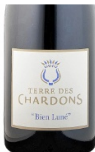
Un vin plaisir.

Prix moyen 9 €, magnum 20 €, bib 35 € En vente directe. Tel. 04.66.70.02.51 ; tdchardons@yahoo.fr ; www.terredeschardons.fr