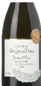
Un vin tonique.

Prix moyen 9,50 €, en vente directe et cavistes. Tel. 04.68.33.90.04 ; combedesducs@orange.fr ;